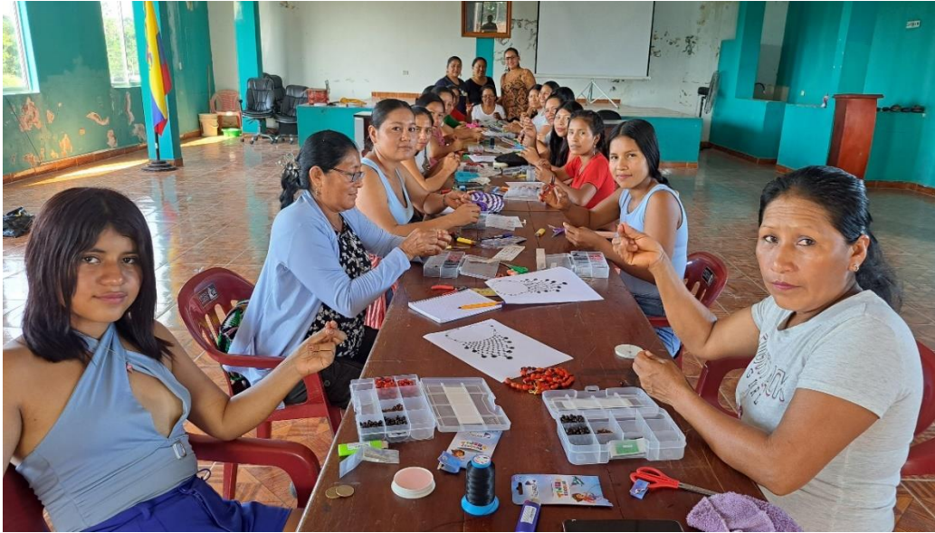
FOTO MATERIALES SEMILLAS