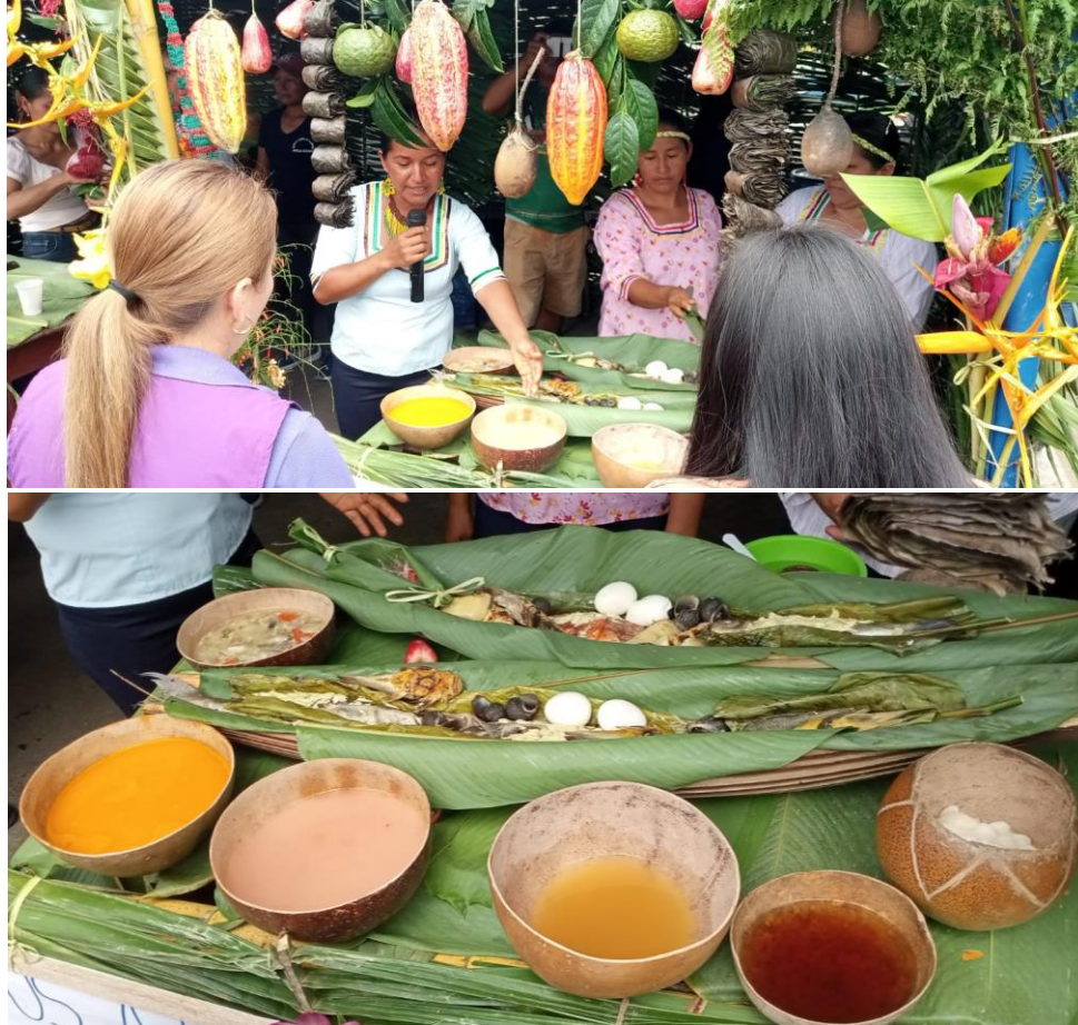
Foto 17; Presentación de stand gastronómico demostrativo Asociación Ávila Warmi