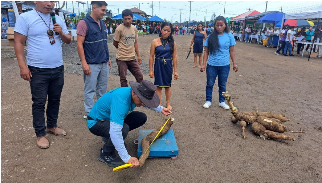
Foto 29 Reconocimeinto de Stands participantes