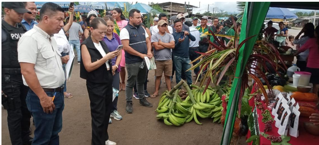
Foto 24 Calificación de Stands